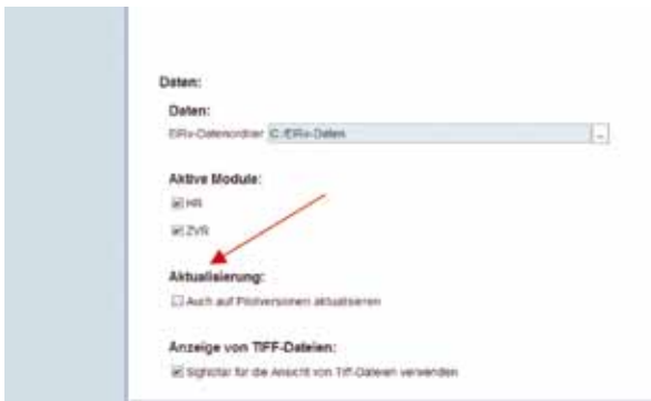
Abb.: Jeder Nutzer kann die Pilotversion von XNotar erhalten.

schließlich sieht die Oberfläche oft anders aus als zuvor und die benötigten Funktionen sind nicht mehr an ihrem gewohnten Platz. Schließlich treten Fehler auf, die vorher nicht enthalten waren, da es dem Hersteller nicht gelungen ist, die Anforderungen des Bürobetriebs vollständig und realistisch nachzustellen. Im schlimmsten Fall ist das Arbeiten mit dem Programm eingeschränkt oder unmöglich bis ein weiteres Update die Fehler behebt und hoffentlich keine neuen mitbringt. Um derartige Beeinträchtigungen durch notwendige Verbesserungen möglichst gering zu halten, wird Software häufig vorab durch einen begrenzten Nutzerkreis in einem Pilotbetrieb eingesetzt. Erst nachdem das Programm diesen Praxistest bestanden hat, steht die neue Version für alle Nutzer bereit. Für XNotar sind zwischenzeitlich zahlreiche Neuerungen entwickelt worden, die seit Ende Mai als Pilotversion 3.3 genutzt werden können. Die Installation ist für jeden XNotar-Nutzer durch Setzen des Hakens bei „Auch auf Pilotversionen aktualisieren“ in der allgemeinen Verwaltung des Programms auf dem jeweiligen Arbeitsplatz möglich.